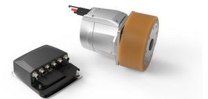
Das FTS-Antriebssystem cyber® iTAS® system 2 von WITTENSTEIN

Die WITTENSTEIN SE entwickelt Produkte, Systeme und Lösungen für hochdynamische Bewegung, präziseste Positionierung und intelligente Vernetzung in der mechatronischen Antriebstechnik.