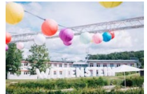
75 Jahre in Bewegung: Tag der offenen Tür bei WITTENSTEIN

Die WITTENSTEIN SE entwickelt Produkte, Systeme und Lösungen für hochdynamische Bewegung, präziseste Positionierung und intelligente Vernetzung in der mechatronischen und cybertronischen Antriebstechnik.